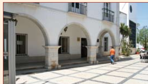
Criação do Balcão Único de Atendimento ao Município