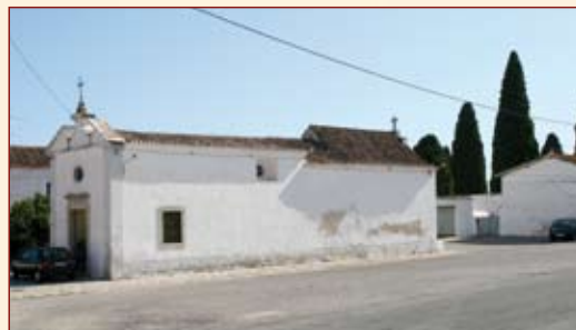
Adaptação de ermidas para velórios