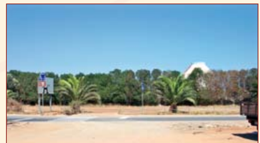
Terreno para construção do novo Quartel dos Bombeiros Municipais