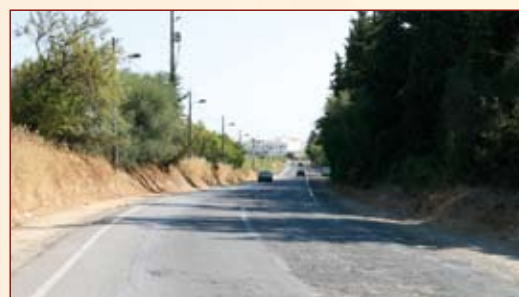
Estrada entre Tavira - Santa Luzia