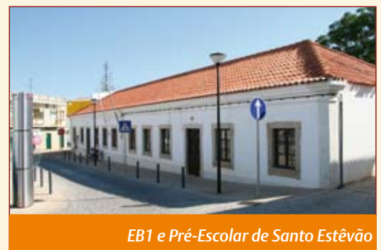
EB1 e Pré-Escolar de Santo Estêvão