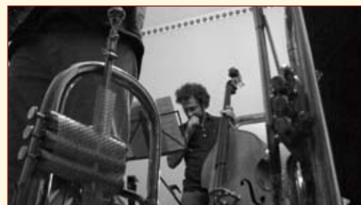
Realização do Festival de Jazz de Tavira