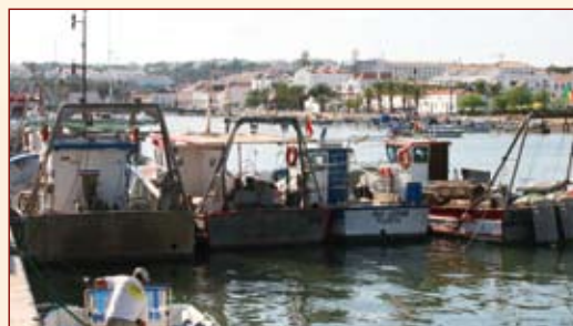
Pugnar pela construção do Porto de Pesca de Tavira