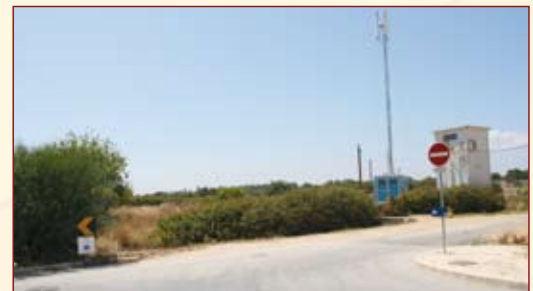
Construção de Parque Estacionamento poente em Cabanas