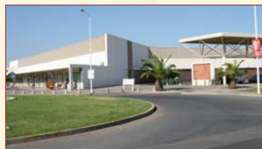
Remodelação do Mercado Municipal de Tavira