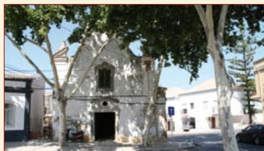
Reabilitação da Igreja de São Roque