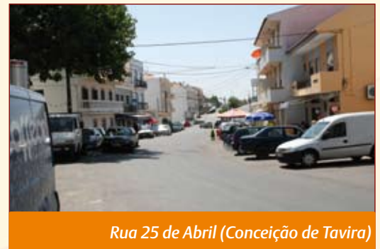
Rua 25 de Abril (Conceição de Tavira)