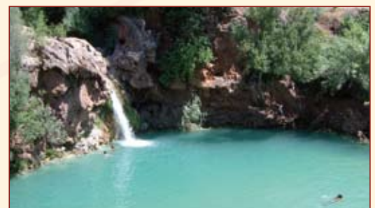
Requalificação do Pêgo do Inferno