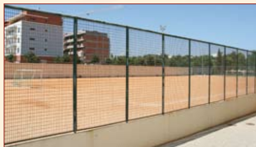
Campo de Futebol junto ao Pav. Eduardo Mansinho