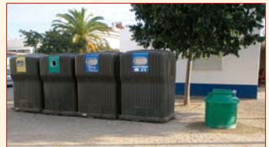
Ampliação da rede de recolha de óleos alimentares