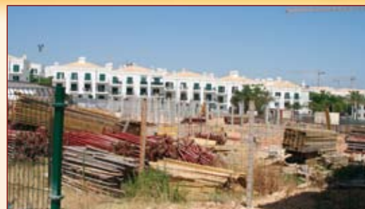
Centro de Dia e Creche da Associação “Pontão”