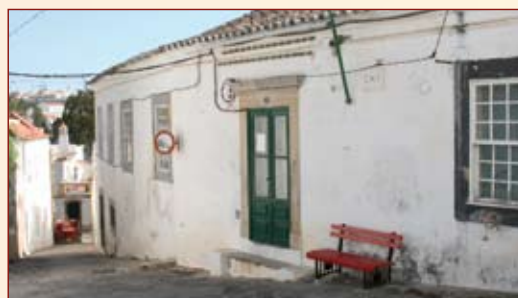
Centro de Gravura Bartolomeu dos Santos