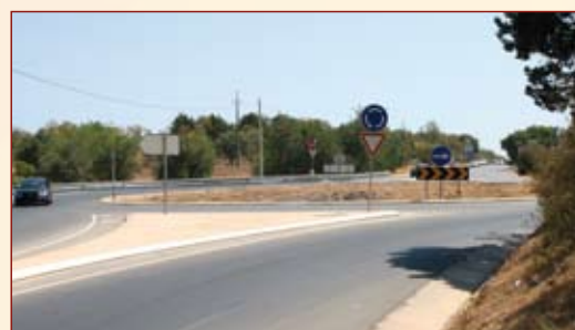
Rotunda da Quinta das Salinas