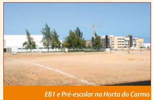
EB1 e Pré-escolar na Horta do Carmo