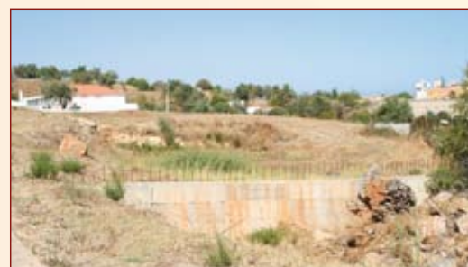
Jardim-de-Infância e Creche Coelho de Lima