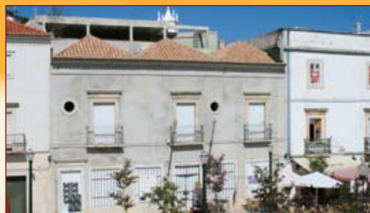
Núcleo Museológico Islâmico