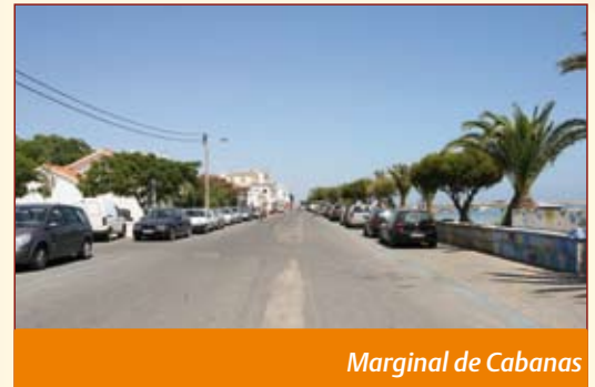
Marginal de Cabanas