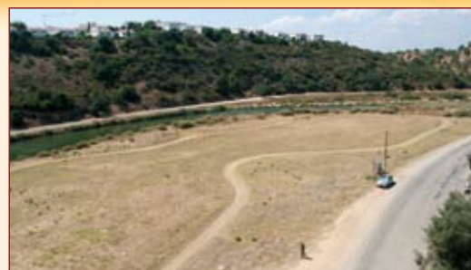
Parque Verde do Séqua