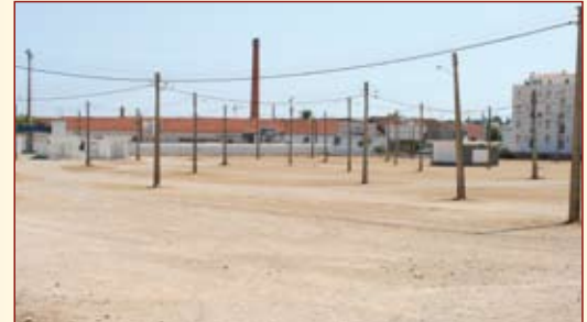
Construção do parque de estacionamento da Horta do Carmo (actual campo da feira)